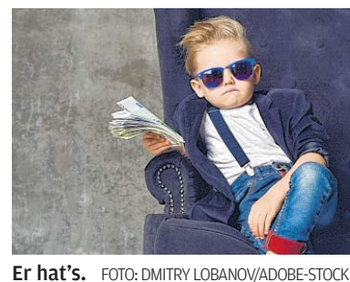
Er hat's.

dingt die Reichen und Schönen bevorzugt werden. Sondern jene, die so schmal und bedürftig sind, dass sie durchs Nadelöhr in den Himmel gelangen. „Reichtum wird in vielen Religionen regelrecht abgewertet und Armut fast zur Tugend erhoben“, haben die Forscher aus Mannheim festgestellt. Das heißt: Religiosität kann den Schmerz betäuben, arm zu sein. Opium fürs Volk. Also doch. Hatte der olle Karl Marx schon wieder mal recht. Und wer nicht an Gott glaubt, leidet gewiss an Entzugerscheinungen. Was tun? Was nehmen? Welches Placebo hilft? Wenn ich einmal reich wär', widiwidwidwidibumbum... Singt Tevje, der Milchmann aus Anatevka, arm an Geld, reich an Kindern. Sein Bariton brummt sich in unsere Seelen ein, lässt die Sorgen tanzen wie einen Fiedler auf dem Dach. Kunst kann wie Religion sein. Wir glauben an ihre Kraft. Widiwidwidwidibumbum... Ulrich Hammerschmidt